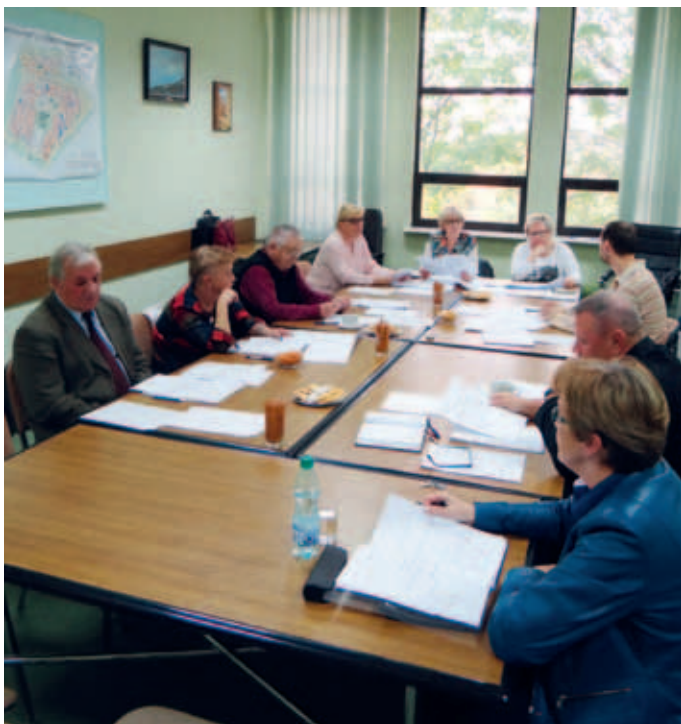
Posiedzenie Rady Nadzorczej ŚSM