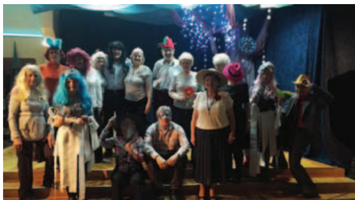
Na klubowych ostatkach humor dopisywał wszystkim gościom

25 lutego z okazji zakończenia Karnawału zaprosiliśmy do Klubu Seniorów na Ostatki . Przy dobrej muzyce przeplatanej licznymi zabawami i konkursami z nagrodami pożegnaliśmy Karnawał.