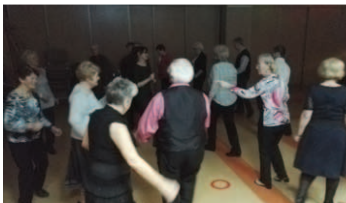
Zabawa ostatkowa dla Seniorów