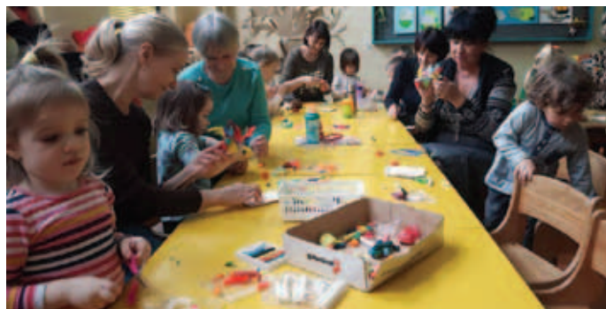
Zajęcia artystyczne w Klubie Malucha

gimnastyka pań, fitness, zumba, ceramika