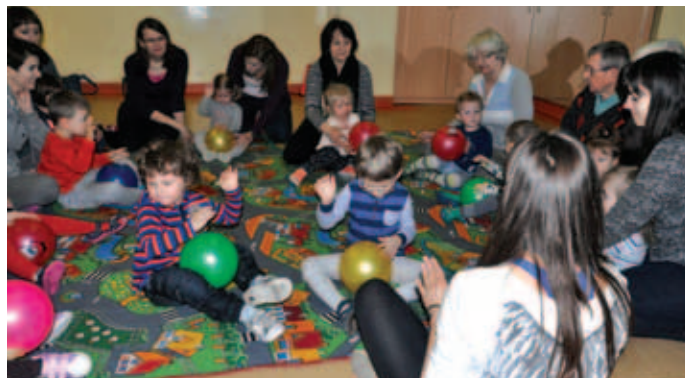
Zajęcia rytmiczne dla maluchów