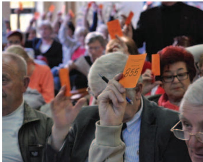
Wpływ na działania podejmowane przez spółdzielnię, poprzez możliwość uczestniczenia w obradach najwyższego organu jakim jest Walne Zgromadzenie Członków powinno przysługiwać wyłącznie osobom posiadającym tytuł prawny do lokalu w zasobach danej spółdzielni

W projekcie przewidziano także, że rada nadzorcza będzie zobowiązana podjąć uchwałę o ustaniu członkostwa w terminie jednego miesiąca od dnia powzięcia informacji o utracie przez członka spółdzielni spółdzielczego własnościowego prawa do lokalu albo prawa odrębnej własności lokalu lub ekspektatywy tego prawa, albo o rozwiązaniu umów o budowę loka-