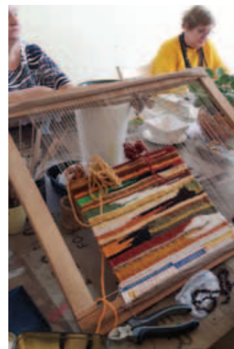
Środowe spotkania Art Senior