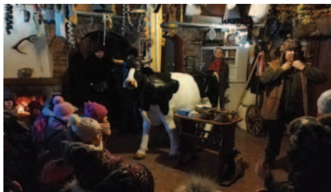
Wycieczka do Ostoi Dworskiej

poświęcili swój czas wolny codziennie w godz. 9.30- 15.00 aby bezinteresownie pomagać innym za co serdecznie dziękują dzieci i pracownicy Klubu.