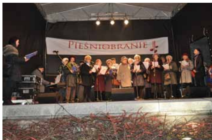
Niepodległościowe „Pieśniobranie” z naszymi Seniorami