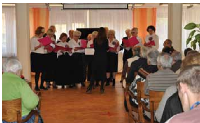
Zespół „Wrzosa” w DPS im. Jana Pawła II