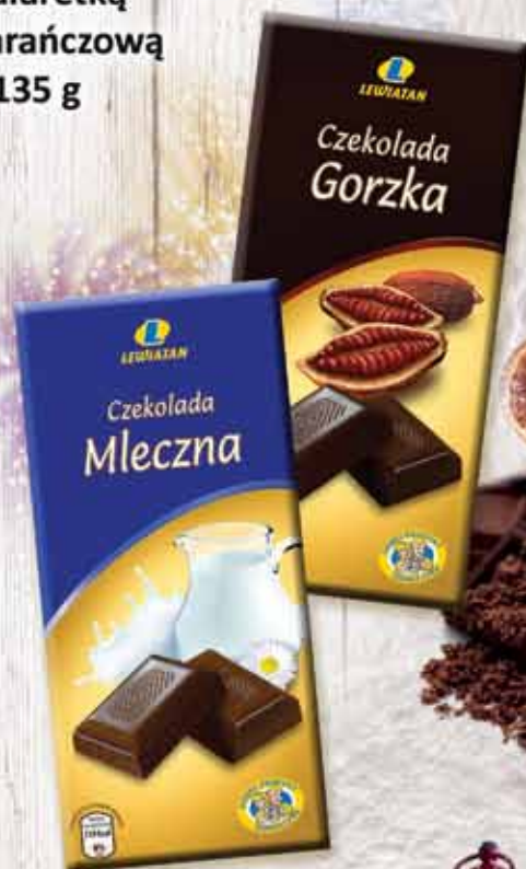
Czekolada 90 g: mleczna, gorzka