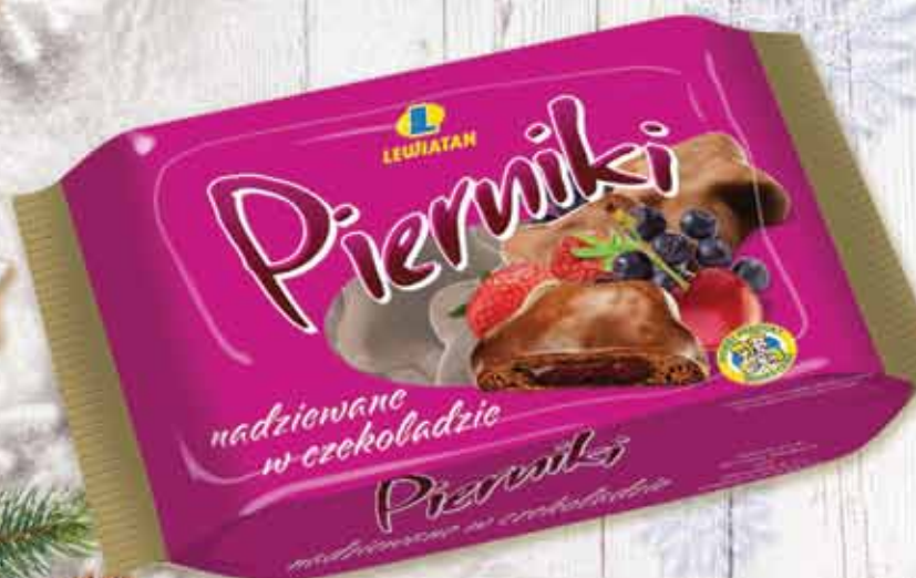
Pierniczki nadziewane w czekoladzie 200 g