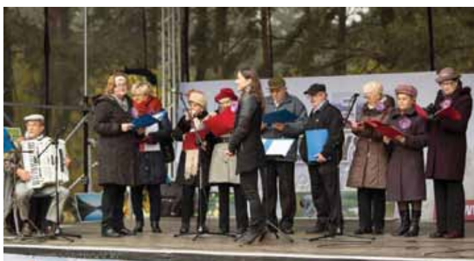
Zespół „Wrzosa” zaprezentował repertuar dla Seniorów na kieleckim „Stadionie”

W naszym mieście od wielu lat odbywają się cykliczne imprezy mające na celu propagowanie wspólnego śpiewania z okazji świąt i ważnych wydarzeń historycznych takich jak Święto Konstytucji 3 Maja, Święto Niepodległości, Święto 3 Króli pod hasłem „Pieśniobranie”. 11 XI Nasz chór po raz kolejny w tym roku przyłączył się do wspólnego śpiewania kielczan prezentując się na scenie z utworem „Pieśń o Wodzu miłym”.