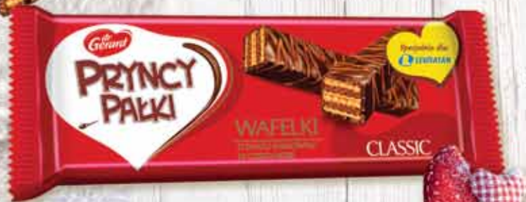
Pryncypałki 170 g