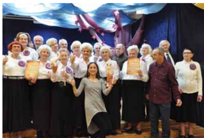
Chór „Wrzosa” - I miejsce w kat. „Piosenka 20-lecia Międzywojennego”