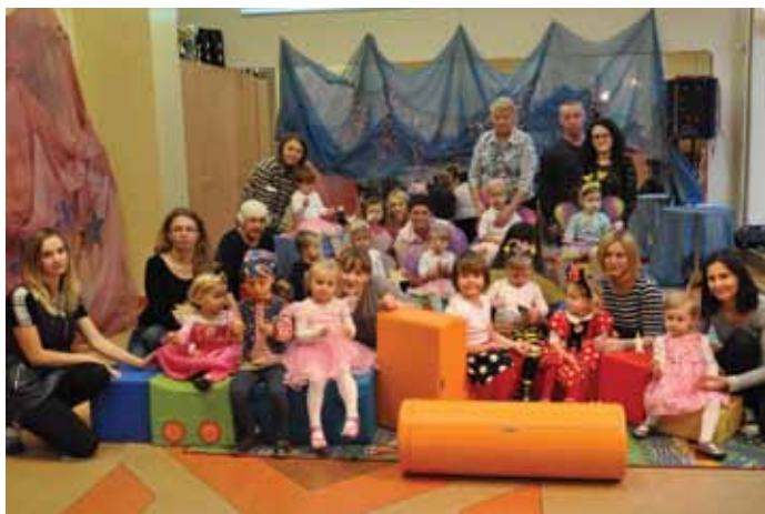
Bal andrzejkowy w Klubie „Malucha”

6 XII dzieci z Klubu Malucha odwiedził Św. Mikołaj z workiem pełnym prezentów. Jeżeli chcieliby Państwo by ich dzieci spotkały się ze Św. Mikołajem zapraszamy do kontaktu z Klubem w przyszłym roku pod koniec listopada.