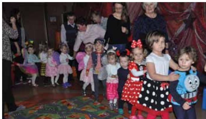
„Andrzejki” w Klubie „Malucha”