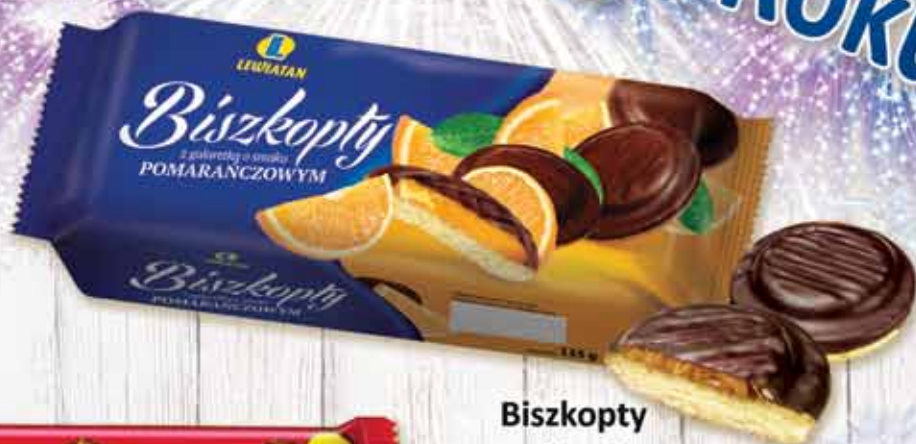
Biskopity z galaretką pomarańczową 135 g