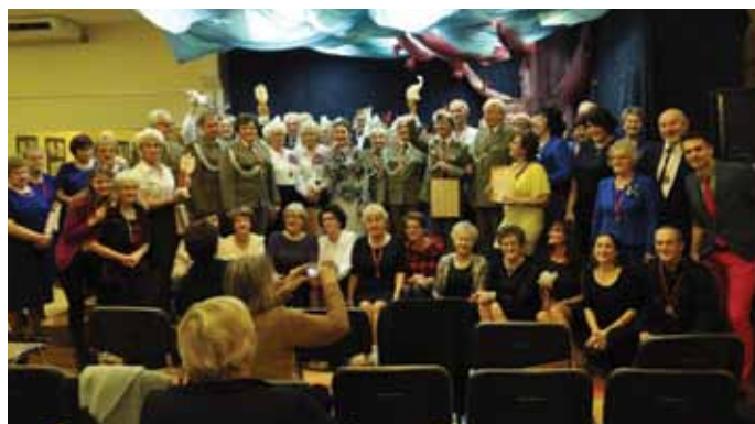
Uczestnicy VI Festiwalu Piosenki Seniora