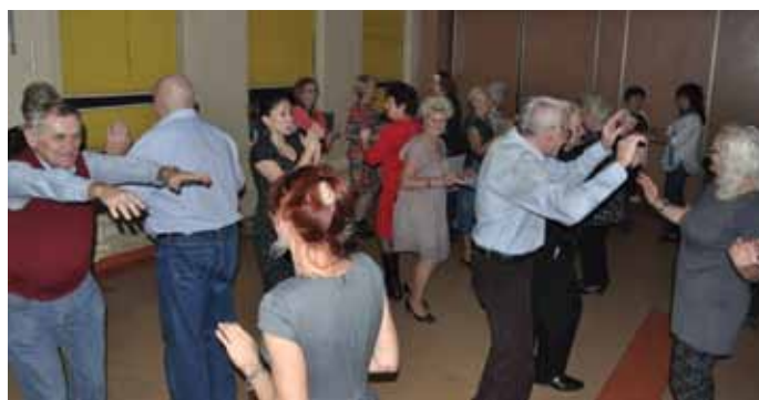
„Andrzejki” dla Seniorów w Klubie „Uroczysko”