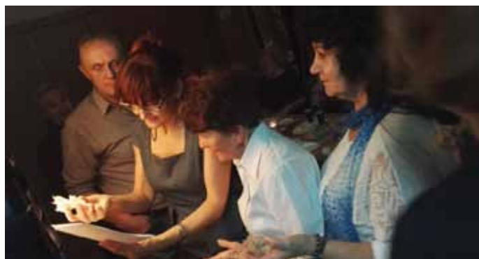
Andrzejkowe lanie wosku dla dorosłych