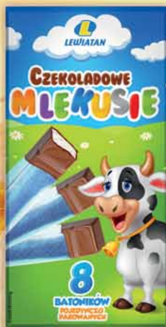
Batoniki czekoladowe Mlekusie 100 g