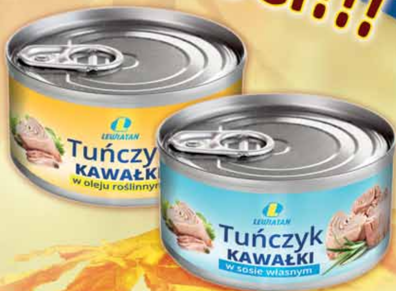
Tuńczyk kawałki 170 g: w sosie własnym, w oleju roślinnym