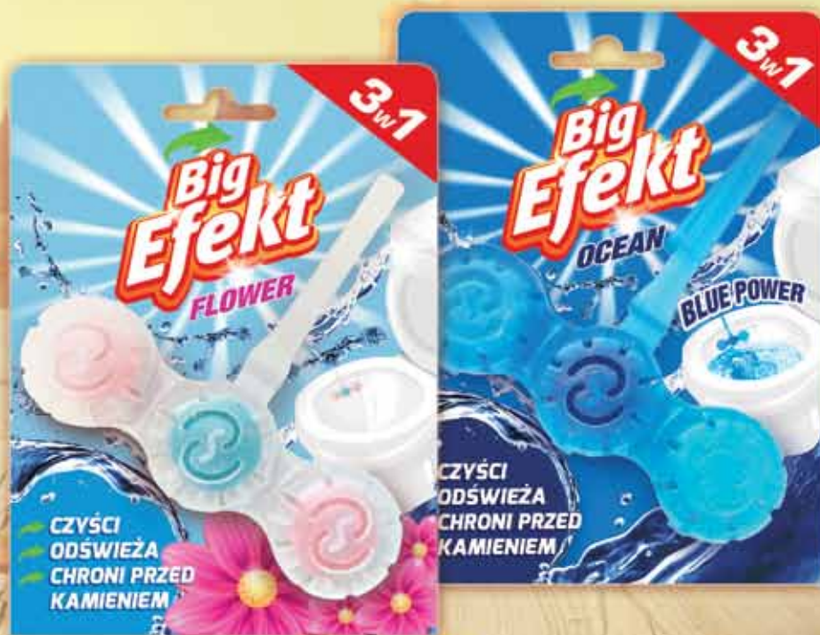
Zawieszka do toalet Big Efekt 40 g: ocean, flower