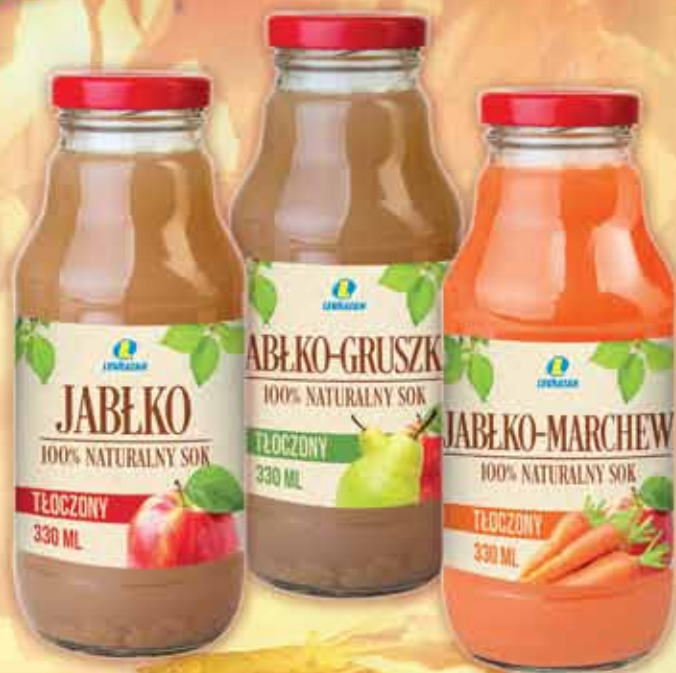
Sok tłoczony 330 ml: jabłko, jabłko-marchew, jabłko-gruszka