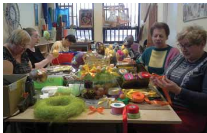
Cykliczne warsztaty Art Senior

GIMNASTYKA SENIORA (poniedziałek i piątek 13.00-13.45), KIJKI (wtorek 12.00-14.00), ZESPÓŁ WOKALNY (środa 12.30-14.45), WARSZTATY ART. SENIOR (środa 12.30-14.30 i piątek 14.00-16.00), RODZINNA CERAMIKA (piątek 17.00-19.30), BRYDŻ, TENIS STOŁOWY ( poniedziałek i piątek 10.00-13.30 ), GIMNASTYKA PAŃ (poniedziałek i środa 18.00-18.45), FITNESS (poniedziałek i środa 19.00 -19.45), SALSALSA (czwartek 19.30-20.30)