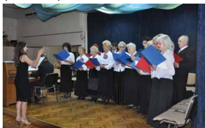
Zespół Wrzosy działający w naszym klubie