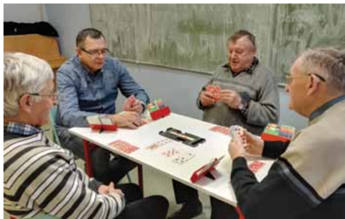
Cotygodniowe spotkania brydżowe

Informacje dotyczące w/w zajęć uzyskają Państwo w Klubie ŚSM I piętro, pok nr 8. Zajęcia dla seniorów prowadzone są nieodpłatnie z wyjątkiem gimnastyki seniora gdzie opłata stała wynosi 20 zł za 5 miesięcy zajęć.