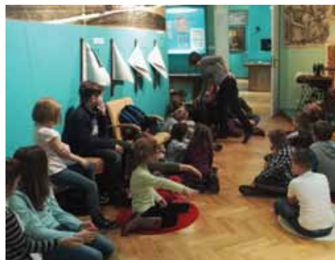
Akcja zima w mieście - warsztaty w Muzeum Historii Kielc

Od zeszłego roku w zajęciach bierze udział coraz większa grupa 6 latków, które świetnie sobie radzą i doskonale odnajdują się w konwencji zajęć klubowych.