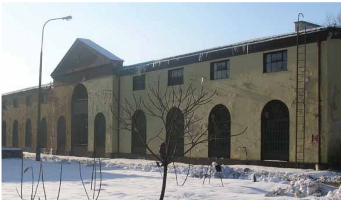
Dawny budynek Huty Aleksandra w KFP Białogon

„Ktokolwiek będziesz w świętokrzyskiej stronie...” i tu trzeba chyba zakończyć trawestację słynnej ballady Mickiewicza, gdyż współczesny mu podróżny, „zatrzymawszy swe konie” gdzieś w dolinie Kamiennej, Czarnej, Bobrzy, czy Silnicy ujrzałby zapewne widok zupełnie odmienny od tego opisanego przez wieszczka.