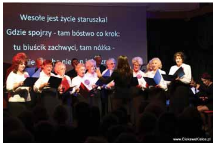
Chór Wrzosay na Pieśniobraniu z okazji 100 rocznicy urodzin Jeremiego Przybory