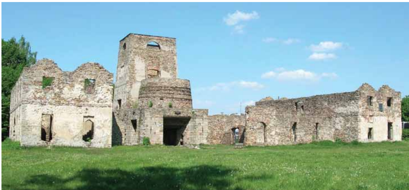
Tyle zostało dziś z wielkiego pieca w Samsonowie