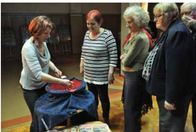
Wróżby Andrzejkowe - lanie wosku

10 XII rozstrzygnęliśmy ogłoszony w X konkurs plastyczny dla dzieci od 3 do 13 lat pt. „Pracownia Św. Mikołaja. W konkursie udział wzięło 143 dzieci z naszego osiedla. Nagrodą w konkursie było przedstawienie teatralne teatru Skrzat z Krakowa pt. „Zimowe przygody Krysi Kaprysi” oraz Wizyta Św. Mikołaja, który wręczył dzieciom nagrody za udział w konkursie. Imprezie towarzyszyło otwarcie wystawy pokonkursowej.