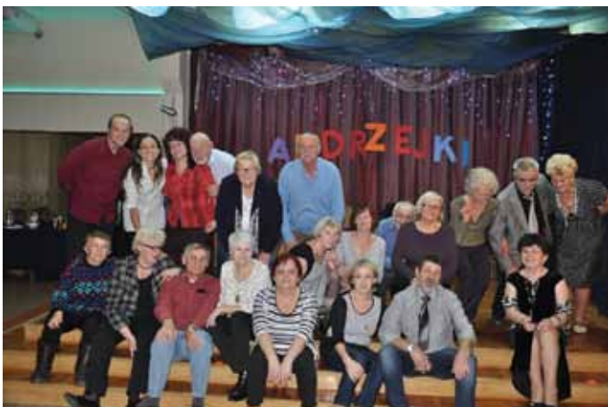
Andrzejki w Klubie Seniora

27 listopada Wieczór Andrzejkowy dla dorosłych upłynął pod hasłem dobrej zabawy połączonej z wróżbami i tańcem. Uczestnicy zabawy jak zawsze przynieśli ze sobą poczęstunek, a klub zapewnił dobrą muzykę i wróżby łącznie z laniem wosku i odczytywaniem znaczenia powstałych kształtów.