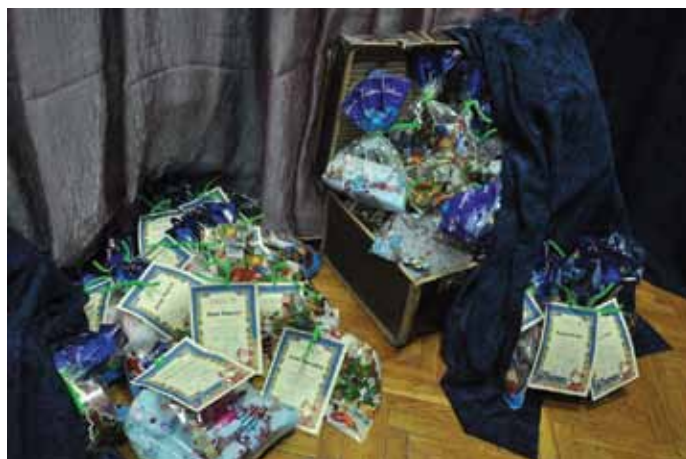
Na wszystkie dzieci uczestniczące w konkursie czekały nagrody

18 XII zapraszamy wszystkich mieszkańców na Wieczór Wigilijny. W programie znajdą się najpiękniejsze kołody i wiersze Bożonarodzeniowe. Jak co roku rozstrzygniemy konkurs na najsmaczniejszy domowy wypiek. Na wszystkich, którzy przyniosą na Wieczór Wigilijny domowy wypiek czekać będą atrakcyjne nagrody związane ze Świętami Bożego Narodzenia. Zapraszamy do udziału w konkursie zarówno dzieci jak i dorosłych.