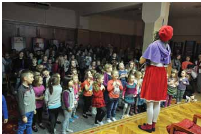
Przedstawienie teatralne z okazji Mikołajek

10 XII rozstrzygnęliśmy ogłoszony w X konkurs plastyczny dla dzieci od 3 do 13 lat pt. „Pracownia Św. Mikołaja. W konkursie udział wzięło 143 dzieci z naszego osiedla. Nagrodą w konkursie było przedstawienie teatralne teatru Skrzat z Krakowa pt. „Zimowe przygody Krysi Kaprysi” oraz Wizyta Św. Mikołaja, który wręczył dzieciom nagrody za udział w konkursie. Imprezie towarzyszyło otwarcie wystawy pokonkursowej.