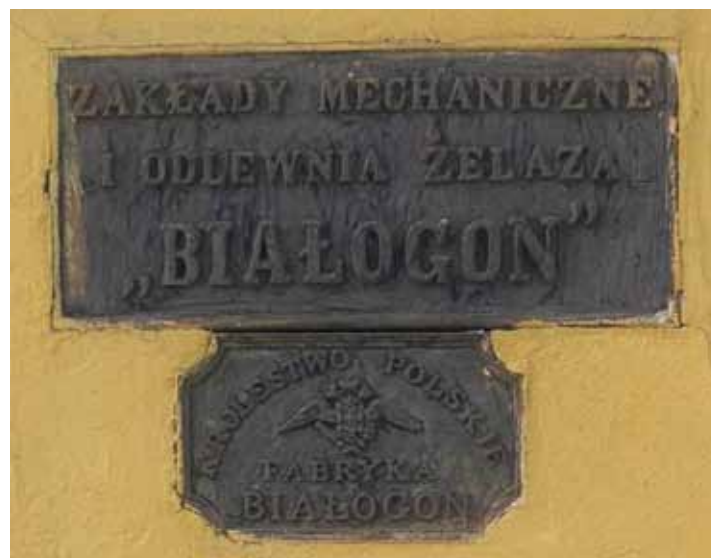
Oryginalne logo Zakładów Mechanicznych Białogon

Większość z nich nie wytrzymała próby czasu, z różnych względów kończąc swoją działalność, inne jednakże, jak np. białogońska Huta Aleksandra przetrwały do dziś, oczywiście przechodząc różnorodne procesy