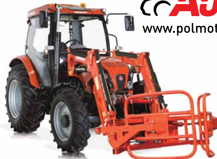
C 380 75KM + TUR4