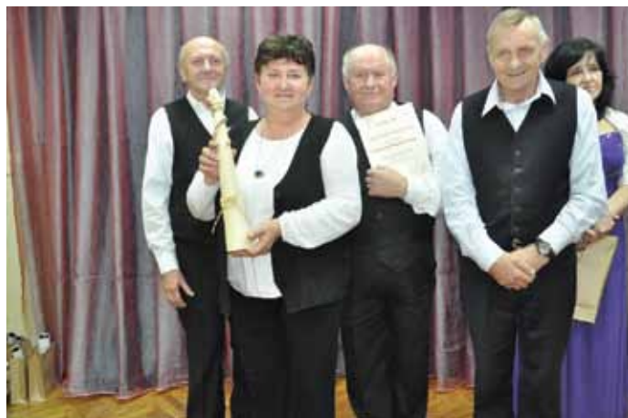
Kapela świątokrzyska - laureaci I miejsca w kat. Chóry i Zespoły

W kategorii Chóry i Zespoły nagrodę otrzymała Kapela Świątokrzyska, która podbiła serca publiczności.