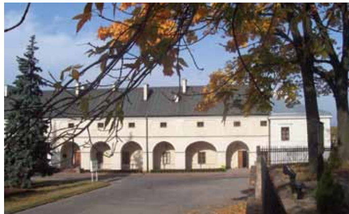
Siedziba Szkoły Akademiczno-Górnicznej w Kielcach

zresztą dość duże podobieństwo do regulaminu Akademii z Freibergu, a także opis regulaminowego munduru i oznak. Wspomniany regulamin jest sam w sobie niezwykle interesującym dokumentem, mogącym stanowić temat wartościowego opracowania naukowego. Określa on w 106 paragrafach bardzo szczegółowo nie tylko organizację szkoły, tok nauczania, wymagania i rygory dla poszczególnych roczników, zasady przyznawania stypendiów, ale także np. „Przepisy co do obyczajności” czyli po prostu dość surowy zbiór zasad studenckiego savoir vivre , które musiały być skrupulatnie przestrzegane przez biednych żaków. Szczególną uciążliwością odznaczał się z pewnością słynny § 87 „...gdy uczęszczanie do domów publicznych, np. do Sklepów, Szynków, na Bilardy i.t.d. oraz odwiedzanie