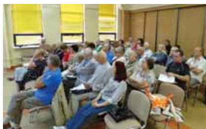
Zebranie Członków Rad Nieruchomości ŚSM dot. rewitalizacji naszego Osiedla

Zebrani Członkowie Rad Nieruchomości pozytywnie zaopiniowali przedstawione projekty oraz złożyli wniosek o rozszerzenie zakresu realizacji prac o zagospodarowanie terenu u zbiegu ulic Warszawska - Orkana. Zgłoszony projekt zakłada usytuowanie na ww. terenie urządzeń do ćwiczeń i rekreacji dla młodzieży i dorosłych oraz wybudowanie skate parku, który wcześniej był planowany w innej części naszego Osiedla. Opis wszystkich zgłoszonych wniosków zaprezentujemy Państwu w kolejnym numerze Magazynu.