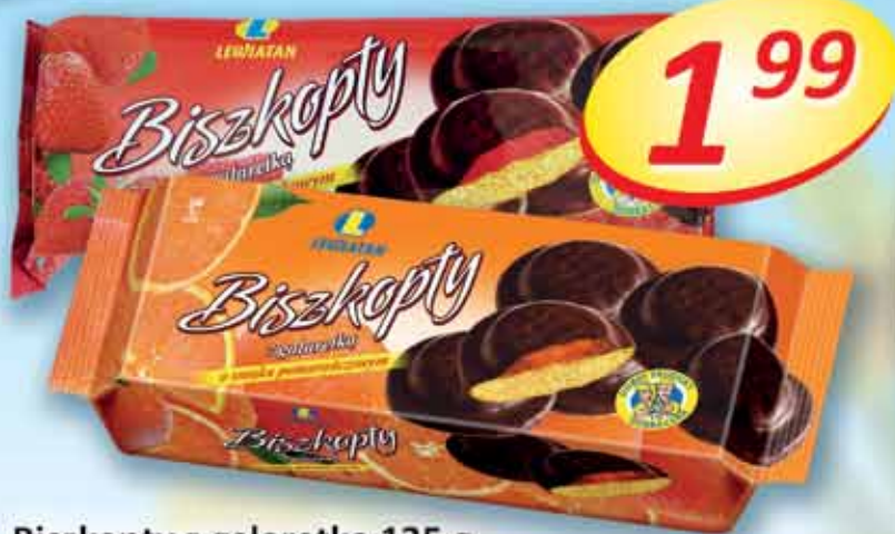
Biskopity z galaretką 135 g