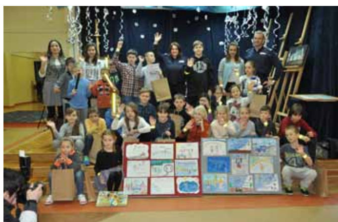
I miejsce w konkursie „Błękitne ferie”

Zapraszamy do Klubu Uroczysko na cykliczne zajęcia w kołach zainteresowań: MALUCHY – rytmika i bawialnia artystyczna 2-3 I (wtorek i czwartek), angielski malucha (poniedziałek), zajęcia plastyczne (środa). DZIECI W WIEKU SZKOLNYM – zajęcia plastyczne (poniedziałek, wtorek, środa), zajęcia taneczne w grupach wiekowych (wt.- sob.), karate w grupach wiekowych (środa i piątek), rodzinne zajęcia ceramiczne (piątek), zajęcia wokalne (czwartek), indywidualna nauka gry na pianinie. DOROŚLI – gimnastyka pań (poniedziałek i środa), fitness (poniedziałek i środa), zajęcia taneczne pań (czwartki), gimnastyka seniora (poniedziałek i piątek), zajęcia taneczne seniora (poniedziałek), próby zespołu „Wrzosa” (środa), zajęcia ceramiczne (piątek). Informacje i zapisy na zajęcia – 606 119 228, (41) 331 10 74, ul. Warszawska 155 I p., pok. nr 8.