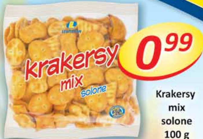
Krakersy mix solone 100 g