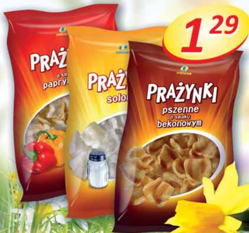
Prażynki 70 g: bekonowe, solone, paprykowe