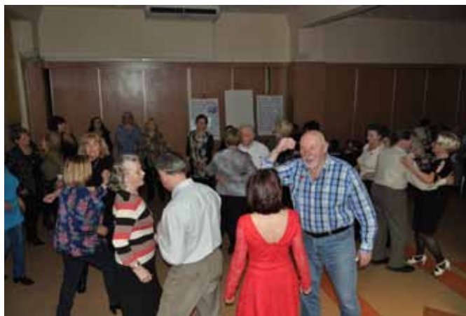
Ostatki w Klubie „Uroczysko”

W okresie ferii zimowych 16-27 II klub Uroczysko zorganizował dla dzieci w wieku 6-12 lat półkolonie pod hasłem „ Na Poligonie” i „ Na Balu Karnawałowym”. W codziennych zajęciach udział wzięło 66 dzieci. Dzieci spędzały aktywnie czas wyjeżdżając z opiekunami na kryty basen w Nowinach, biorąc udział w warsztatach edukacyjnych, zwiedzając Geopark i muzea, biorąc udział w grach i zabawach integracyjnych. Do klubu zostali zaproszeni policjanci i strażnicy miejscy, którzy poprowadzili dla dzieci zajęcia o zasadach bezpieczeństwa w domu i poza nim. Miło nam poinformować że dzieci reprezentujące naszą Spółdzielnię zajęły I miejsce w międzyspółdzielniowym konkursie plastycznym organizowanym przez Komendę Miejską Policji w Kielcach pt. „Błękitne Ferie”. Tematem konkursu były zasady bezpieczeństwa w czasie zabaw zimowych.