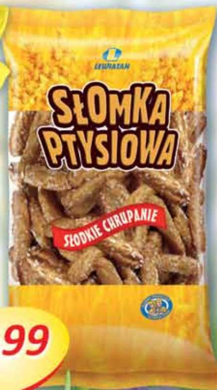
Słomka ptysiowa 115 g