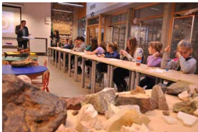
Wizyta w Geoparku