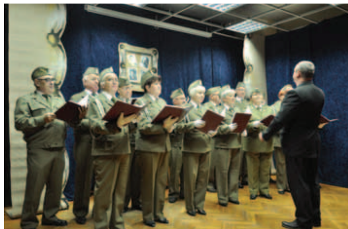
Nagroda Publiczności dla zespołu „Leśne Echa”