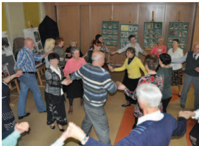
Andrzejki dla mieszkańców

28 XI zaprosiliśmy naszych Seniorów do wspólnej zabawy Andrzejkowej. Warunkiem uczestnictwa było zgłoszenie w Klubie Uroczysko chęci