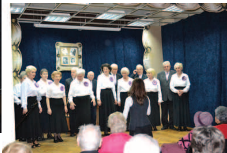
Nagroda Specjalna dla zespołu Wrzosa: Z Klubu Uroczysko.

Swoją nagrodę przyznała również zgromadzona na festiwalu publiczność. Nagroda Publiczności