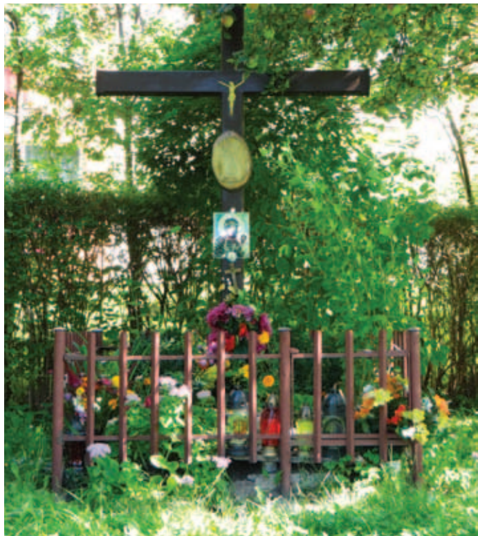
Kapliczka od strony balkonów - ul. Orkana 40

Zwracamy się z prośbą, jeżeli mają Państwo informację dotyczącą historii kapliczki (kiedy i z jakiego powodu została postawiona), prosimy o podzielenie się nią z nami. Chętnie opiszemy Jej historię na łamach naszego Kwartalnika. Kontakt tel.: 41 331-10-01 wew. 113, mailowy: m.cugowski@ssmkielce.pl lub osobiście pok. nr 17.