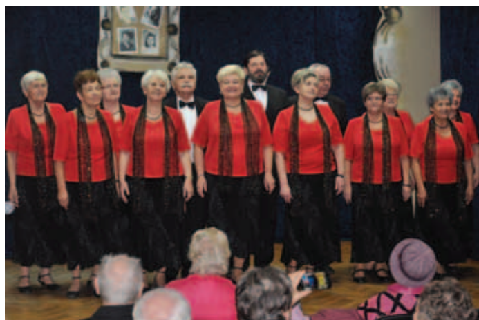
I miejsce Zespół „Relaks”