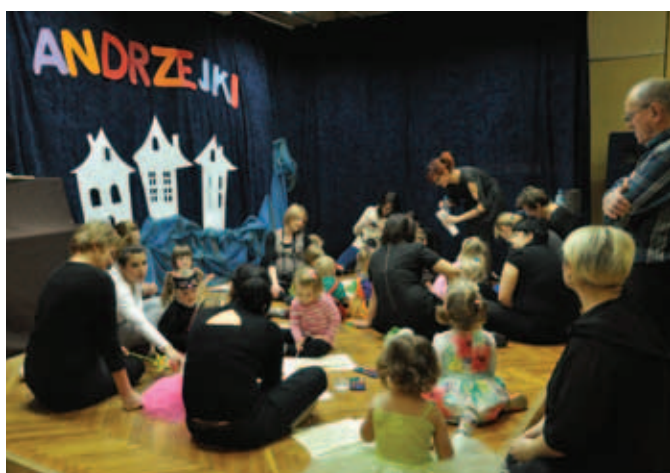
Andrzejki dla dzieci