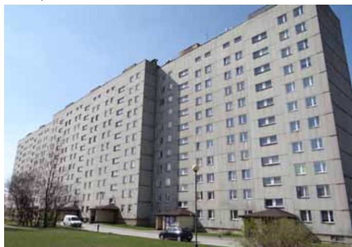
Wieżowiec, ul. Warszawska 161