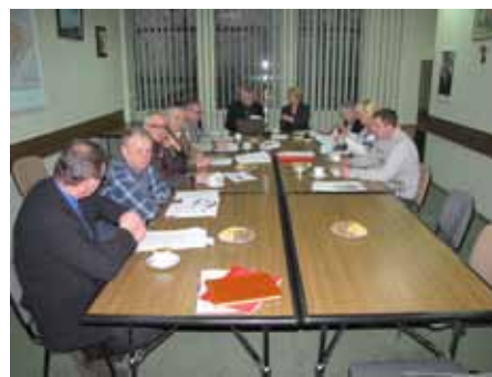
Rada Nadzorcza ŚSM

Rada Nadzorcza powołała Zespół kontrolny do przeprowadzenia analizy dotychczasowych działań organów i służb spółdzielni w zakresie rozliczania zużycia wody w budynkach mieszkalnych. Zadaniem tego zespołu jest wypracowanie wniosków dla potrzeb Rady Nadzorczej zmierzających do uregulowania problemu. Celem Rady jest wprowadzenie takich rozwiązań regulaminowych i technicznych, które zminimalizują problem różnic bilansowych w zużyciu wody.