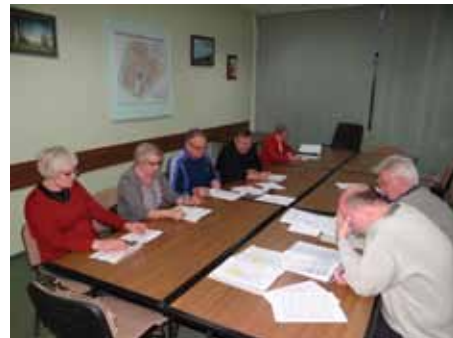
Rada Nieruchomości I/5

nia członków Rad Nieruchomości Świętokrzyskiej Spółdzielni Mieszkaniowej.