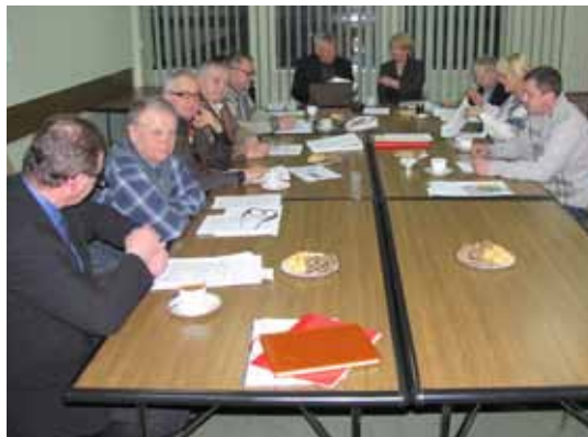
Posiedzenie Rady Nadzorczej

Rada Nadzorcza na bieżąco kontroluje realizację uchwał własnych oraz Walnego Zgromadzenia.