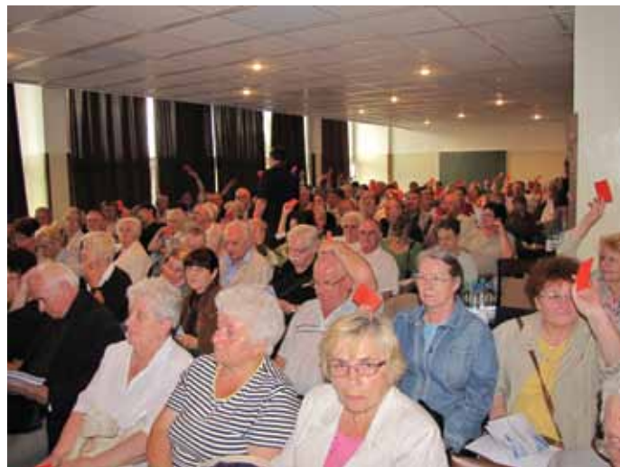
Głosowanie Członków ŚSM na WZCz 2013

Sposób realizacji wniosków dotyczących robót w nieruchomościach mieszkaniowych oraz anteny zbiorczej był już konsultowany z Radami Nieruchomości na sierpniowych posiedzeniach Rad.