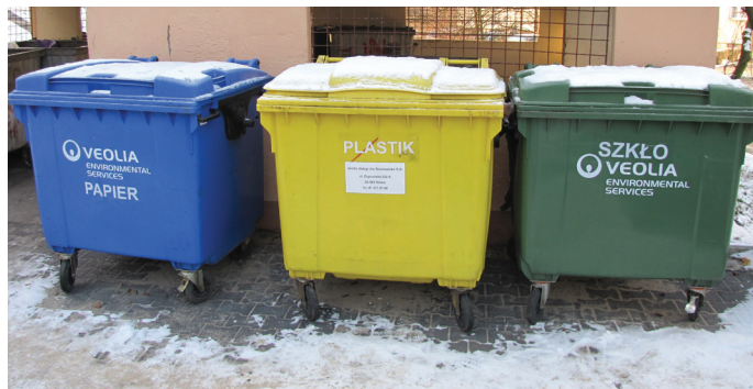
Za segregowane śmieci od lipca 2013 r. zapłacimy 9,5 zł/os.

Nie będzie się również opłacało do jednego kosza wyrzucać wszystkiego – przedmioty, które mogą być poddane recyklingowi, stary termometr z rtęcią czy niepotrzebne lekarstwa. Selektywne zbieranie odpadów zdecydowanie bardziej będzie się opłacało. Śmieci posortowane będą mniej bolesne dla naszych kieszeni, ponieważ ich wywóz będzie tańszy.