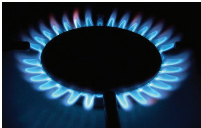
Tlenek węgla - bezwonny i bezbarwny gaz silnie trujący.

Szczelnie pozamykane okna (czasami jeszcze dodatkowo uszczelnione), pozaklejane kratki, brak otworów wentylacyjnych w drzwiach łazienkowych, jak również brak regularnych kontroli drożności przewodów wentylacyjnych i kominowych sprawiają, że w naszych mieszkaniach możemy nie być bezpieczni. W niewietrzonych pomieszczeniach bardzo łatwo może dojść do tragedii.