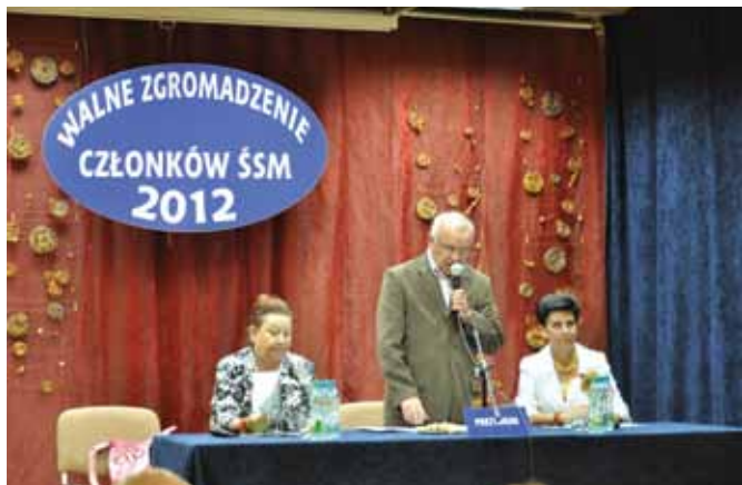
Prezydium I części WZCz

W dniach 25, 26 i 27 czerwca 2012 roku odbyło się w trzech częściach Walne Zgromadzenie Członków Świętokrzyskiej Spółdzielni Mieszkaniowej.