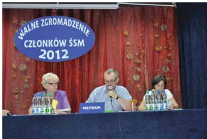
Prezydium III części WZCz

Na podstawie protokołów Komisji Mandatowo-Skrutacyjnych z trzech części Walnego Zgromadze-