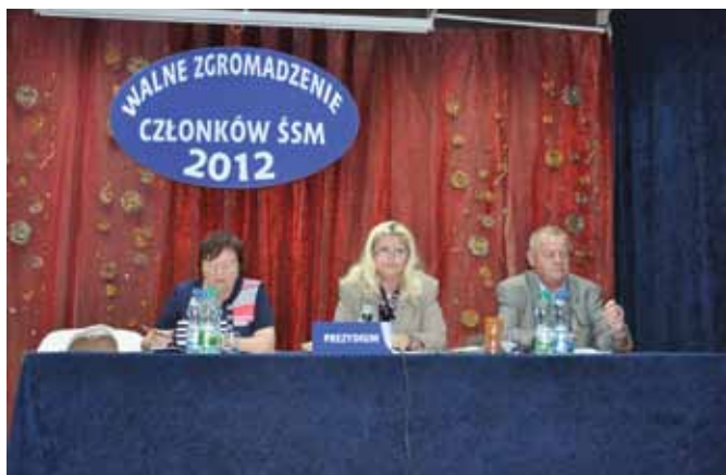
Prezydium II części WZCz