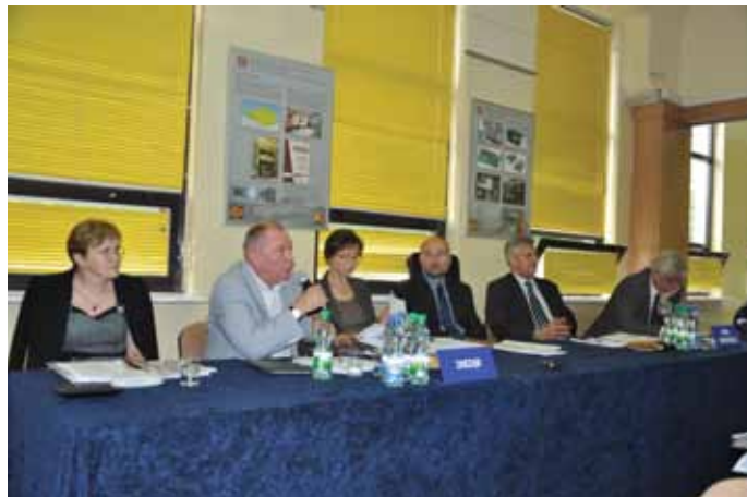
Prezes ŚSM odpowiada na pytanie Członka Spółdzielni