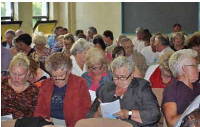
Członkowie wybierają skład Rady Nadzorczej

Walne podjęło również decyzję o podziale nadwyżki bilansowej za 2011 rok. Nadwyżka bilansowa (zysk) wyniosła 1 579 892,08 zł, z czego kwota 1 263 303,35 zł zasilą fundusze remontowe poszczególnych nieruchomości, proporcjonalnie do powierzchni użytkowej lokali mieszkalnych. Dzięki tej uchwale członkowie ŚSM będą mieli relatywnie niższe opłaty czynszowe.