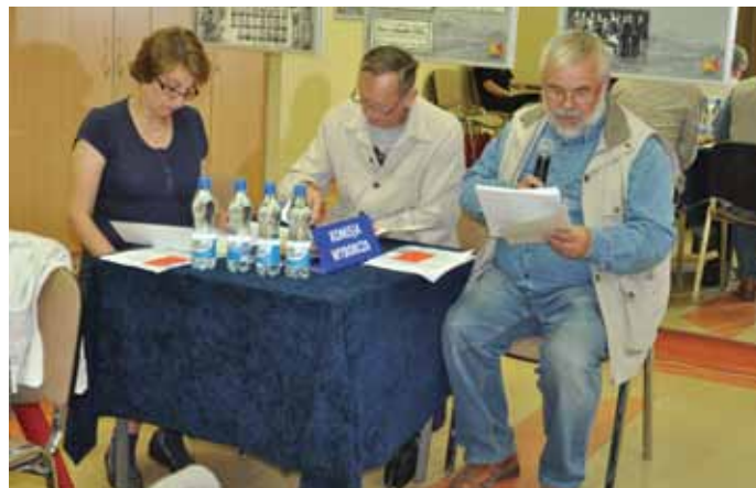
Członek Komisji Wyborczej odczytuje wyniki głosowania do Rady Nadzorczej ŚSM

montowych poszczególnych nieruchomości i 3 które dotyczyły mienia wspólnego ŚSM. Sposób ich realizacji będzie konsultowany z Radami Nieruchomości na najbliższych posiedzeniach Rad. Natomiast wnioski dotyczące mienia wspólnego rozpatrzy i podejmie stosowne decyzje Rada Nadzorcza ŚSM. Informacje o podjętych decyzjach dotyczących rozpatrzenia w/w wniosków Zarząd prześle pisemnie każdemu wnioskodawcy.