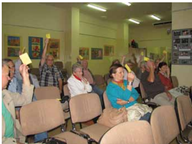
Głosowanie Członków Nieruchomości I/5