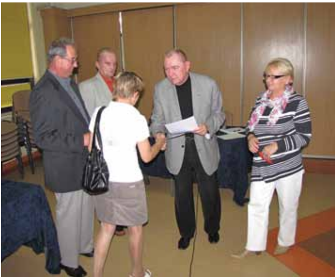
Prezes ŚSM wręcza pamiątkowe dyplomy Członkom Rady Nieruchomości I/8

Wybory członków Rad odbywały się we wrześniu, Nieruchomości I/2, I/3 i I/4, w październiku Nieruchomości I/1, I/5, I/8 i II/1, a z powodów niskiej frekwencji, wybory członków Rad Nieruchomości I/6 i I/7, trzeba było przenieść na pierwsze dni listopada.