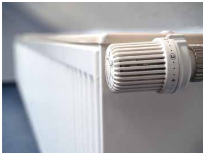
Obniżenie temp. o 1 st. C. daje około 5 proc oszczędności ciepła

Nie wychładzaj mieszkania – ponowne ogrzanie trwa długo i powoduje znaczne zużycie energii cieplnej.