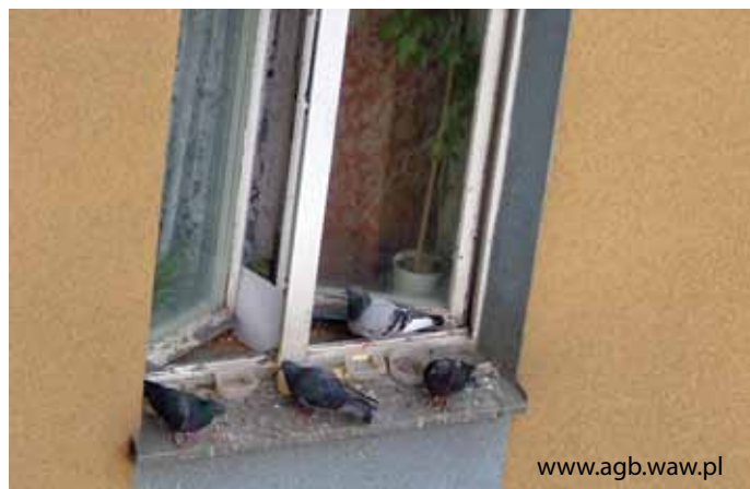
Gołębie nieczystości mogą być zagrożeniem dla zdrowia ludzi, szczególnie małych dzieci

Joanna Przybylska Towarzystwo Badań i Ochrony Przyrody