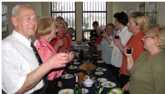
Zakończenie roku kulturalno -oświatowego Chór Seniora