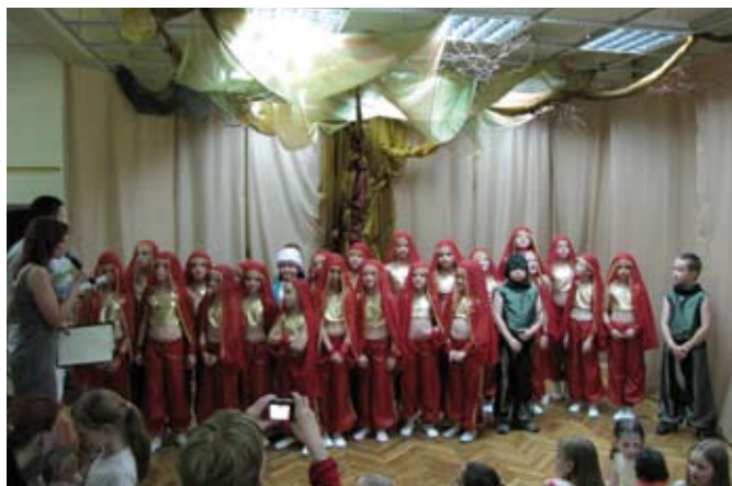
Spotkanie z okazji zakończenia roku połączone z prezentacjami artystycznymi