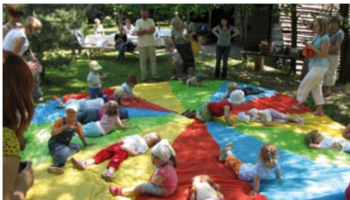
Całodzienny pobyt w gospodarstwie agroturystycznym obfitował w wiele atrakcji