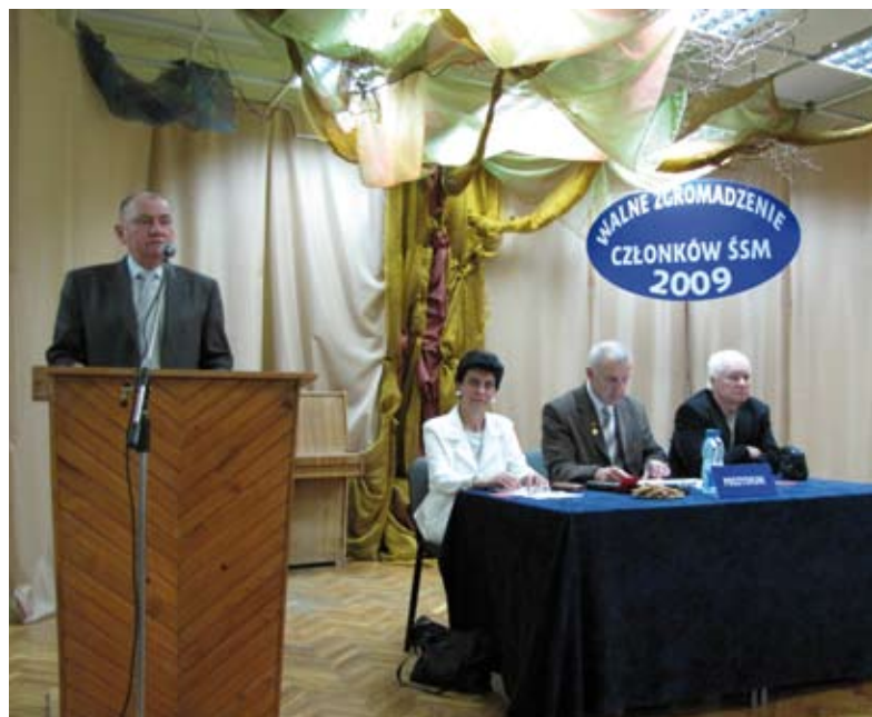
Prezydium I części WZCz

Decyzje trzech części WZCz ŚSM zostały podsumowane na zwołanym, w trybie § 36 ust. 8 i 9 Statutu ŚSM, posiedzeniu przez Zarząd. Celem tego spotkania było