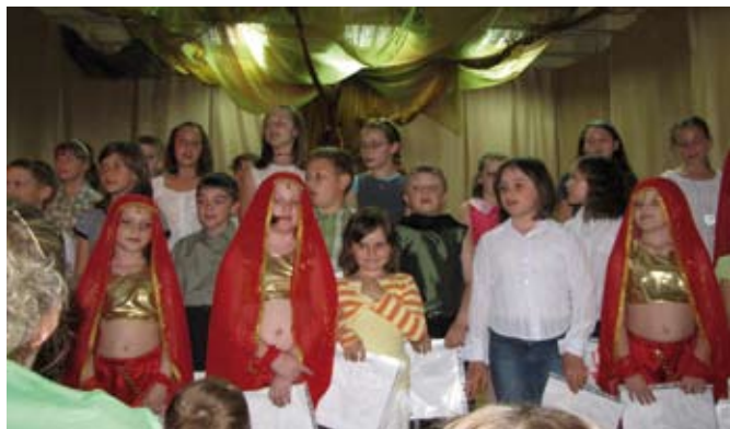
Prezentacje artystyczne z okazji Dnia Mamy