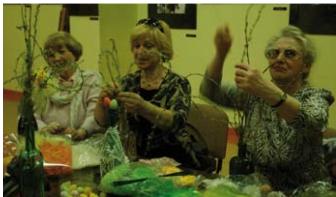
Zajęcia plastyczne w klubie Seniora