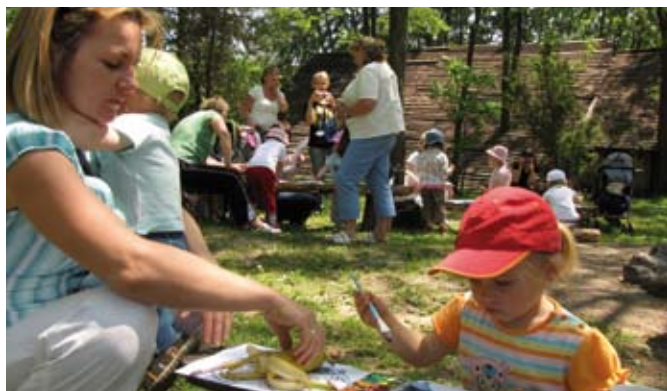
Majówka z klubem „Uroczysko” w Lisowie-Wygwizdowie