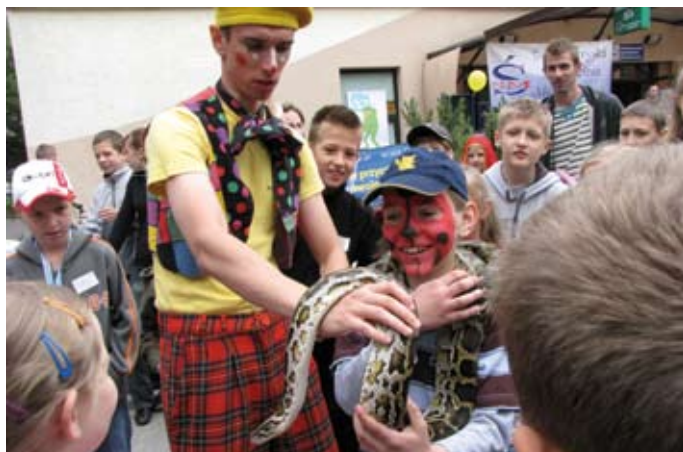
Mieszkańcy skorzystali z wielu atrakcji: malowanie buź, pokaz węża, clownada, tresura pieska, plac zabaw, prezentacja różnych stylów walk i tańców